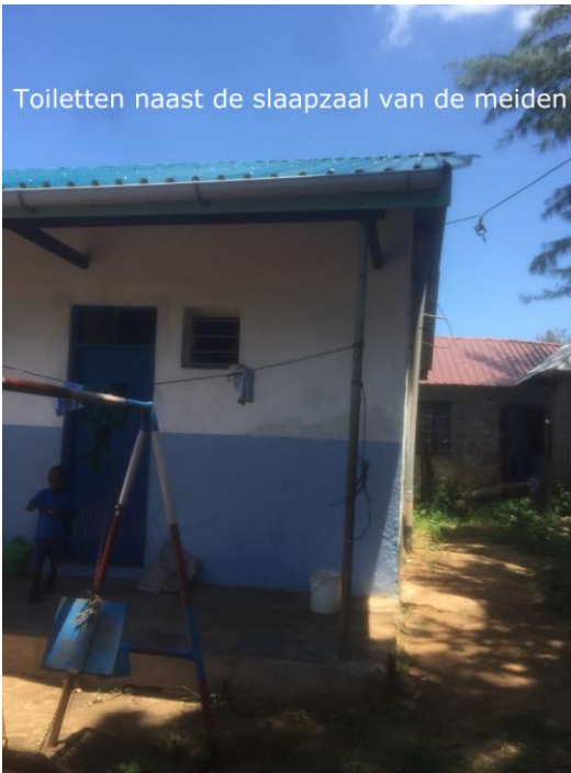
Toiletten naast de slaapzaal van de meiden

Hier eventueel een water tank plaatsen en een 'soak pit', zodat deze toiletten weer gebruikt kunnen worden.